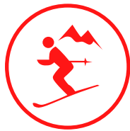
Pistas de Ski