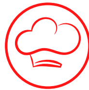
Restaurantes de alta cocina