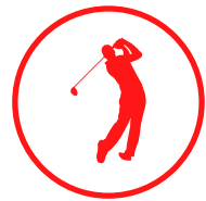
Programa de actividades

Experimentarás la cultura americana y mejorarás tu nivel de inglés a la vez que aprendes las últimas tendencias y pones en práctica tus conocimientos y habilidades en el sector en el que estás trabajando. Aprender de los líderes de tu sector es una garantía de éxito.