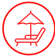
Resort de lujo