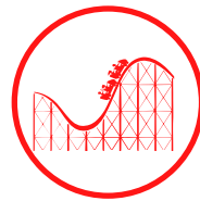
Parques de Ocio